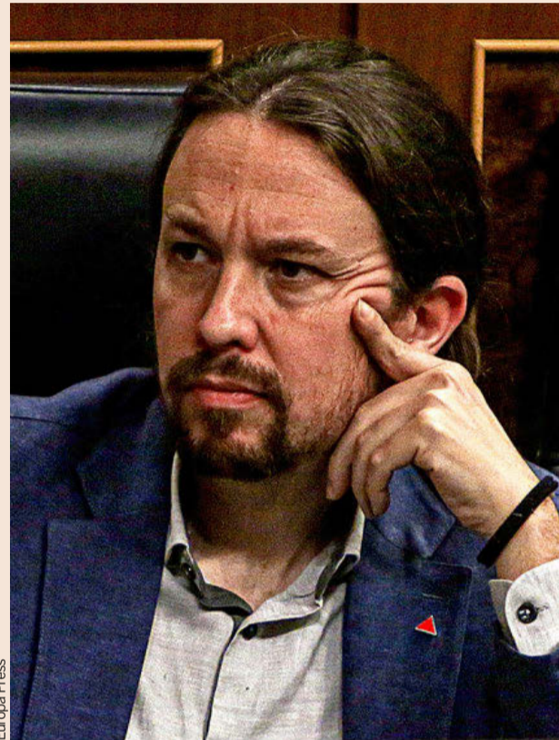
El vicepresidente segundo del Gobierno, Pablo Iglesias.

La idea de Iglesias es disponer de una entidad financiera que cuente con un elevado capital con el que poder abrir el grifo del crédito para aquellas familias y empresas que no cumplieran los requisitos de solvencia o de viabilidad que exija la banca comercial, ya sea por iniciativa propia o por la regulación pública, así como dar facilidad para los proyectos en aquellas áreas que el